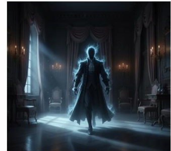
Fantômes de Beaufort