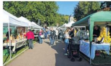
Le parc Chantereine était le rendez-vous de saveurs bio.

nay, Le Neubourg. Ce ne sont que quelques-uns des producteurs qui contribuent à une alimentation saine autant