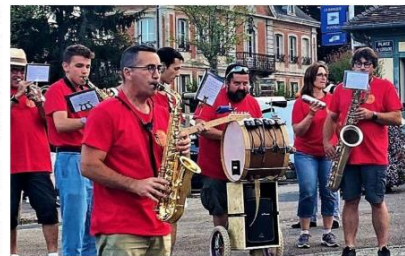
La fanfare Les Z'arts d'Eure assure l'animation musicale.

Pour célébrer le Festival du goût, la fête de la gastronomie locale aura lieu dans le parc Charteraine de Beaumont-le-Roger, le dimanche 12 octobre. Cette journée sera animée par Olivier Maille. Une quinzaine de producteurs seront présents pour le plaisir des papilles. La fanfare Les Z'arts d'Eure sera de nouveau de la partie et de nombreuses animations pour tous sont au menu.