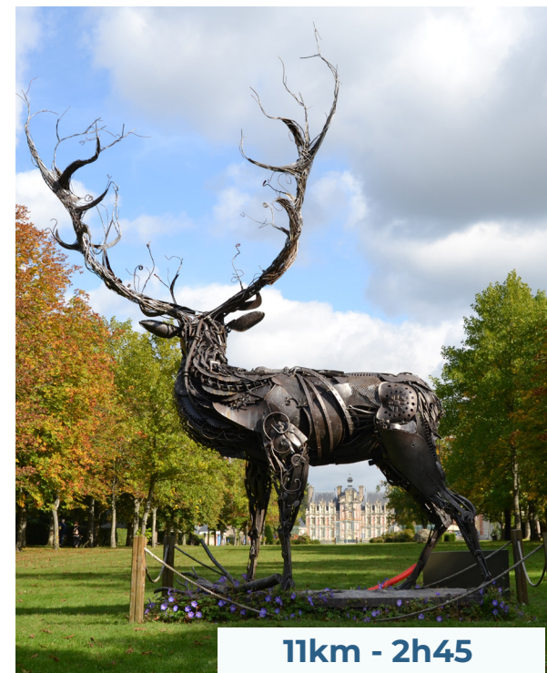
Château de Beaumesnil