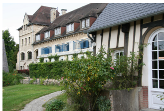
Le monastère Saint Françoise Romaine

C > MONASTÈRE SAINT FRANÇOISE ROMAINE Monastère édifié en 1950, il abrite aujourd'hui une communauté de 26 religieuses, héritières de la tradition léguée à l'Eglise par Sainte Françoise Romaine. Ces Moniales bénédictines ont un lien étroit avec l'abbaye Notre-Dame du Bec Hellouin. Leur atelier de ciergerie propose des bougies de couleurs, de formes et parfums variés.