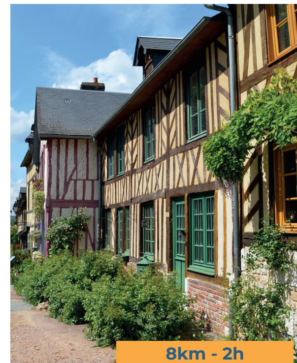
Village du Bec-Hellouin