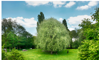
Voie verte Bernay

Selon la légende, un mouton aurait déterré une statuette de la Vierge dans un hameau appelé « La Culture » (devenu ensuite La Couture). Cette découverte est le début d'un pèlerinage et conduit à la construction d'une chapelle, érigée en église au 13e siècle. Elle devient une basilique en 1950.