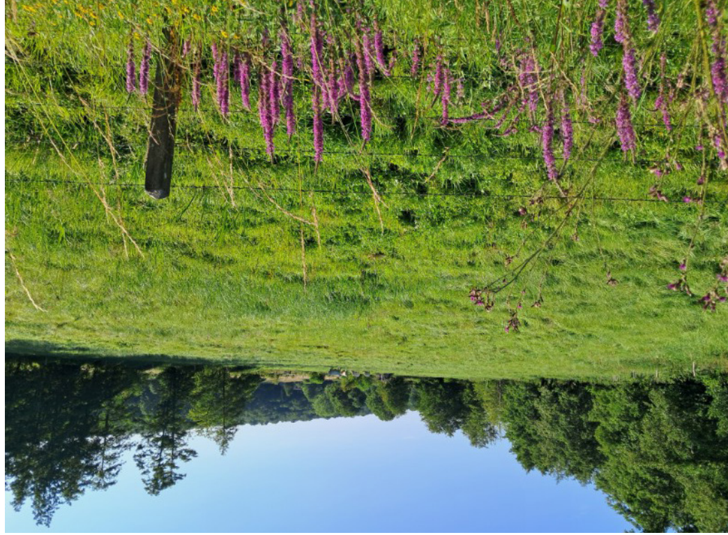
Après le Moulin Fouret

4) Suivre la voie verte sur 1,5 km puis, passé le pont qui surplombe, bifurquer à droite pour suivre le sentier parallèle à la voie verte ( par temps de forte pluie continuer sur la voie verte ) sur 3 km jusqu'au croisement pour retrouver le parking à gauche et le point de départ du circuit.