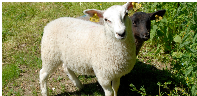
Ferme pédagogique « Chez Poly »