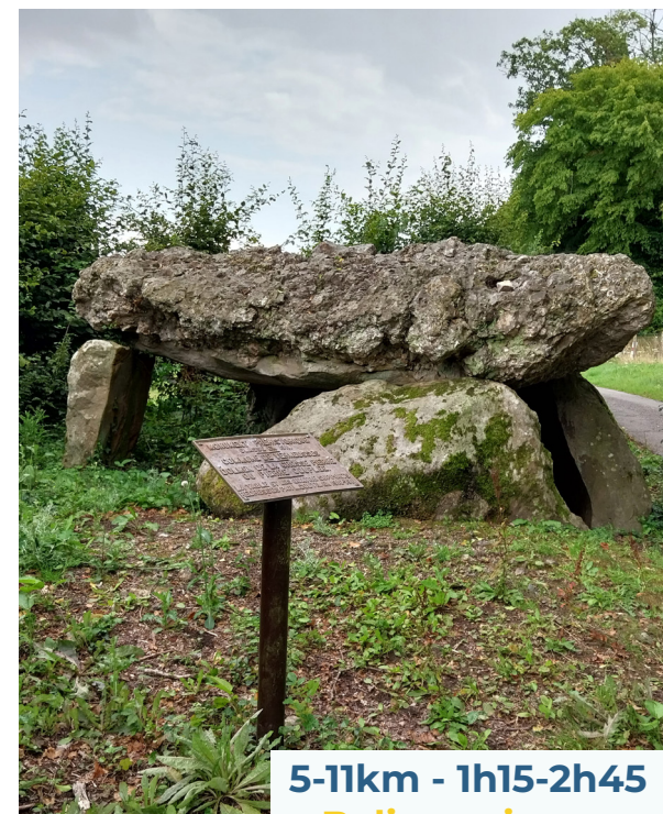
Dolmen à Verneuses