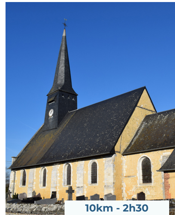
Église de Neuville/Authou