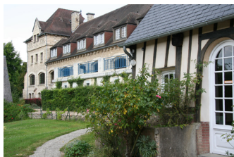
Le monastère Saint Françoise Romaine

C > MONASTÈRE SAINT FRANÇOISE ROMAINE Monastère édifié en 1950, il abrite aujourd'hui une communauté de 26 religieuses, héritières de la tradition léguée à l'Eglise par Sainte Françoise Romaine. Ces Moniales bénédictines ont un lien étroit avec l'abbaye Notre-Dame du Bec Hellouin. Leur atelier de ciergerie propose des bougies de couleurs, de formes et parfums variés.